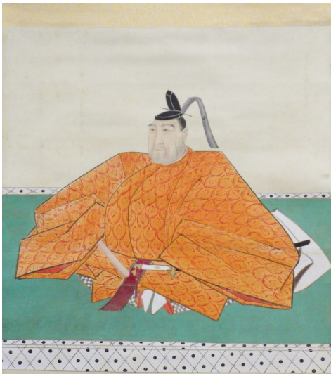
「新発田藩第10代藩主溝口直諒像」

天保(1838)年に40歳で家督を嫡子の直溥に譲り、隠居します。その後、執筆活動をはじめ、茶道を広めるとともに、絵画を描くなどの余生を過ごした後、安政5(1858)年に60歳で没します。